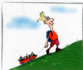
5. Partire soli è più rischioso nel caso portatevi un cellulare