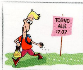
6. Lasciate informazioni sul vostro itinerario e sull'orario approssimativo di rientro