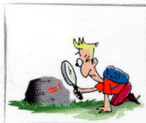
8. fate attenzione a indicazioni e segnaletica che trovate sul percorso