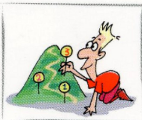
1. Preparate il vostro itinerario