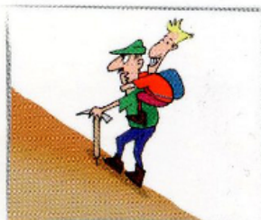
7. Non esitate ad affidarvi ad un professionista