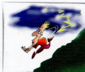
9. Non esitate a tornare sui vostri passi