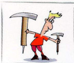
3. Scegliete equipaggiamento ed attrezzatura idonei