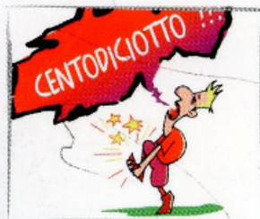
10. In caso di incidente date l'allarme chiamando il 118